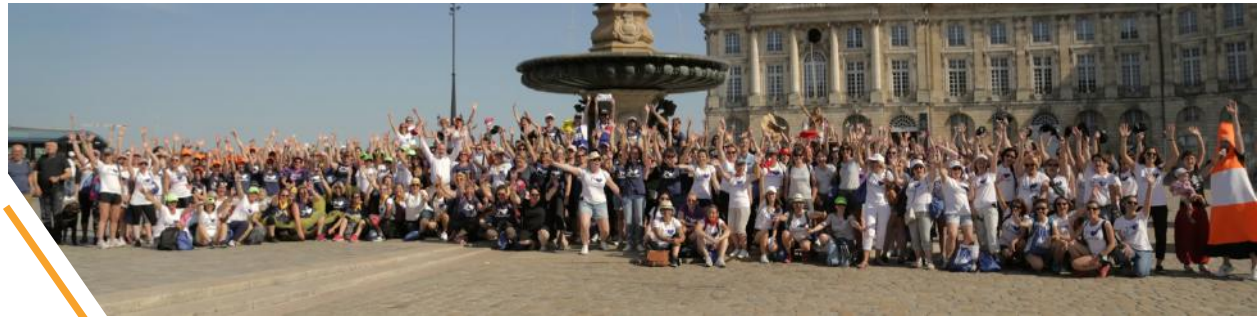
Bordeaux 2018 (Nouvelle-Aquitaine)